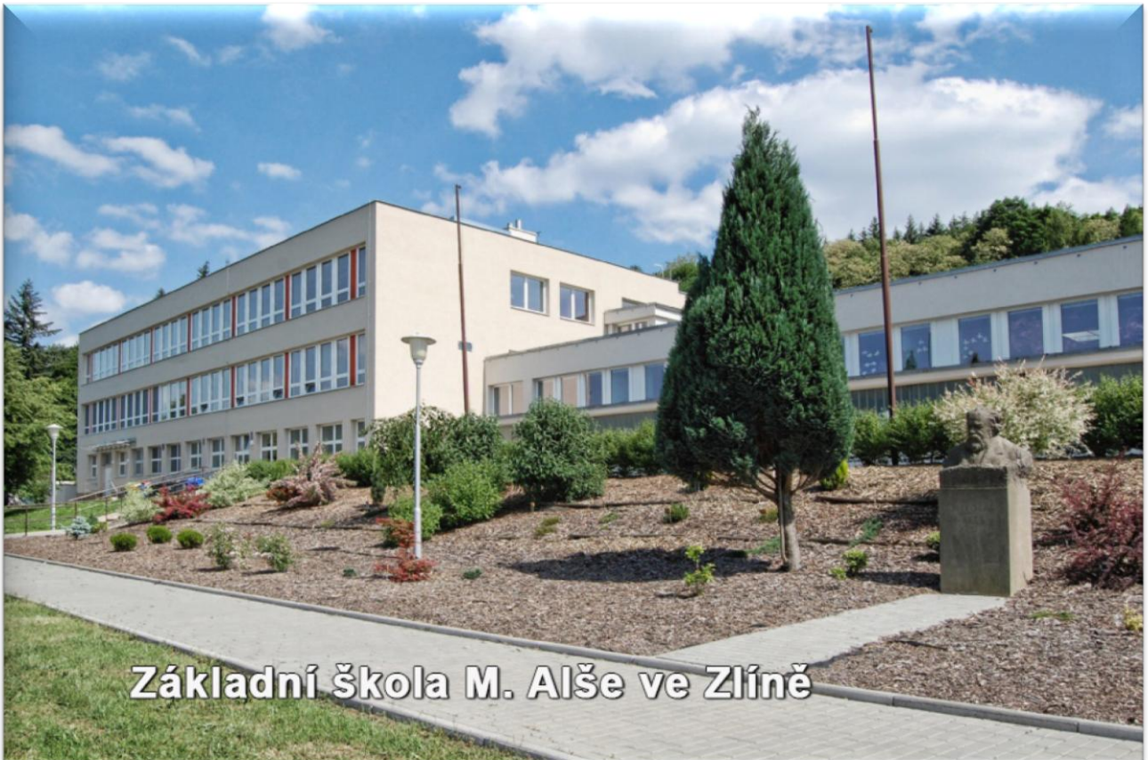
Základní škola M. Alše ve Zlíně